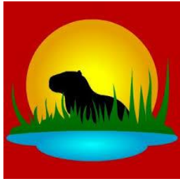
Guardianes del Iberá