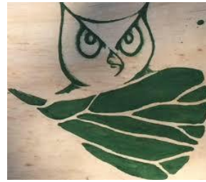
Observatorio Humedales Delta